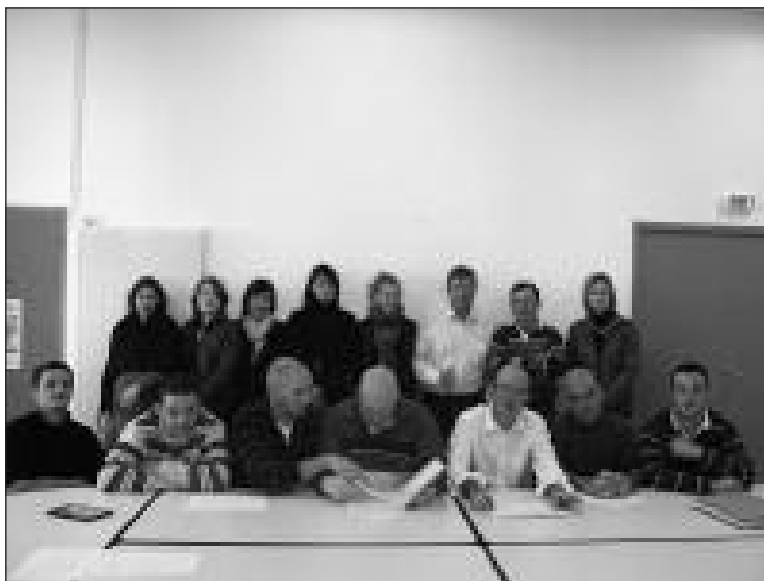
Du bureau à la scène, il n'y a qu'un pas pour ceux-là !