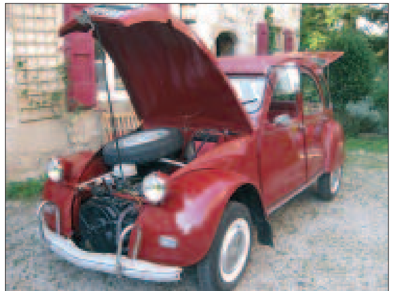
Rouge et rutilante, dehors comme dedans