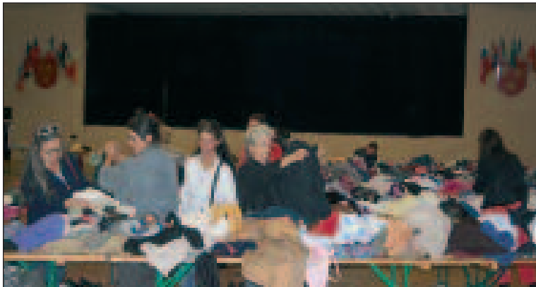
Lors de la manifestation