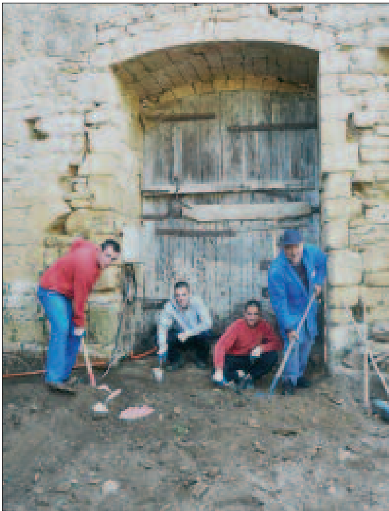
Un chantier qui a beaucoup intéressé ces jeunes