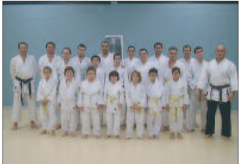
Sur le tatami