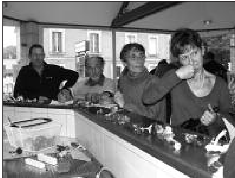
Ne pas se fier à l'odeur parfois "savoureuse" !